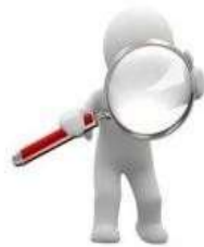
Tipos de Solicitudes