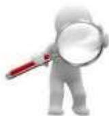
Tipos de Solicitudes